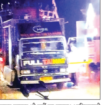
फायर फाइटर भी नहीं जा पाएगा। आतिशबाजी से जानमाल का भी खतरा बना हुआ है

नगर के सघन रिहायशी वाडों एवं अवैध कॉलोनिनों में शासन के नियमों को ताक में रखकर बेखौफ मैरिज गार्डन संचालित है ला इन मैरिज गार्डनों में न तो सुरक्षा के पर्याप्त इंतजाम है और न ही पार्किंग व्यवस्था है। रहवासियों को हो रही परेशानी से शासन-प्रशासन को कोई सरोकार नहीं है। मैरिज गार्डनों में देर रात तक डीजे और लाउड स्पीकर के असहनीय ध्वनि प्रदूषण से रिहायशी क्षेत्र के रहवासी हलाकान हैं। बैंड बाजों एवं डीजे के हार्ड फिक्वेंसी से बच्चे, बुढ़े, सहित लोग देर रात तक सो नहीं पा रहे हैं। ध्वनि प्रदूषण को लेकर मुख्य मंत्री एवं शासन के निर्देश भी बेअसर साबित हो रहे हैं। वाडों एवं कॉलोनिनों में संचालित मैरिज गार्डनों में देर रात को बारतें लग रही हैं, जिसमें जमकर आतिशबाजी की जाती है, इससे आसपास के मकानों व मकानों की छतों पर रखे सामानों में आग लगने की प्रबल संभावना है। कॉलोनी व वाडों के रास्ते इतने सकरे हैं कि