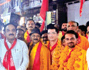
विदिशा। रात 8 बजे निकास पहुंची शोभायात्रा में शामिल हुए न्यायस्थ प्रतिनिधि।

शोभायात्रा निकाली गई। शोभायात्रा बालाजी मंदिर से प्रारंभ होकर बजरिया, बड़ा बाजार, तिलक चौक और निकास मार्ग से होती हुई शोभायात्रा का चित्रगुप्त मंदिर पहुंची। यहां पूजन के पश्चात श्रद्धालु शेरपुरा स्थित चित्रगुप्त मंदिर पहुंचे, जहां महाआरती एवं धर्मसभा का आयोजन किया गया। शोभायात्रा में बैड-बाजे, ढोल और डीजे की धुन के बीच समाजजन उत्साहपूर्वक शामिल हुए। रथ पर सुसज्जित भगवान चित्रगुप्त की आकर्षक प्रतिमा विराजमान थी, जिनका मार्ग में श्रद्धालुओं ने तिलक कर पूजन किया। महिलाएं लाल साड़ी और