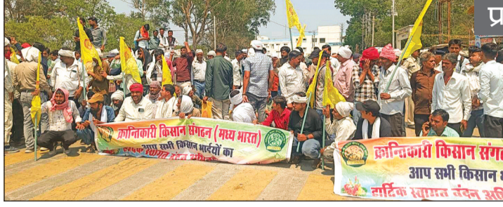
सौंपे ज्ञापन में किसानों की प्रमुख मांगों

समर्थन मूल्य पर गेहूँ-चना उपार्जन में आ रही समस्याओं को लेकर गुरुवार को गैरतमंज में किसानों का गुस्सा सड़कों पर फूट पड़ा। दोपहर की तेज गर्मी के बावजूद सैकड़ों किसान मोपाल-सागर स्टेट हाईवे पर बैठ गए और जोरदार नारेबाजी करते हुए चक्काजाम कर दिया। करीब घंटों तक चले इस प्रदर्शन से मुख्य मार्ग पर यातायात प्रभावित रहा और वाहनों की कतारें लगी गईं। यह आंदोलन क्रांतिकारी किसान संगठन (मध्य भारत) के नेतृत्व में किया गया। किसान जनपद ग्राउंड से रैली के रूप में निकले और मुख्य मार्ग पर पहुंचकर धरने पर बैठ गए। प्रदर्शन के दौरान किसानों ने शासन-प्रशासन के खिलाफ जमकर नारेबाजी की और तत्काल समस्याओं के समाधान की मांग की।